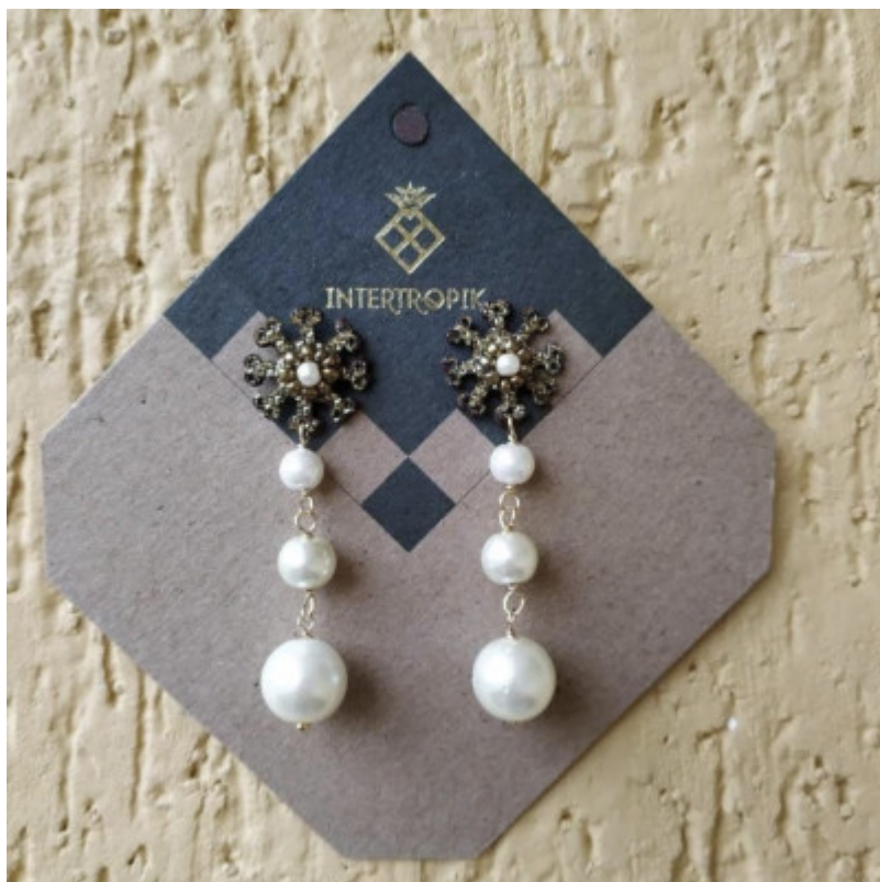
Joyas en bronce con baño de oro de 24K