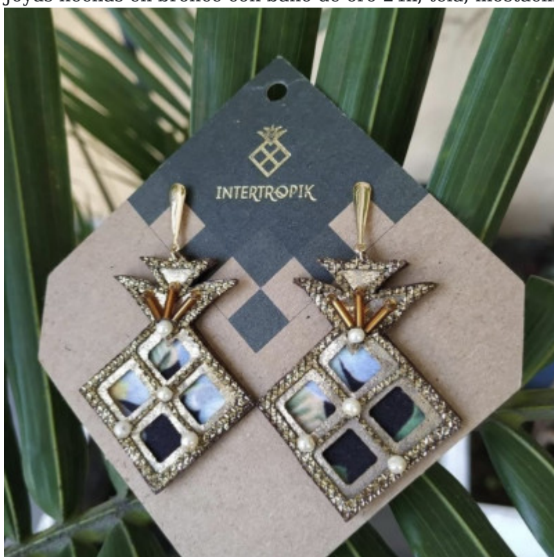
Joyas en bronce con baño de oro de 24K

Joyas hechas en bronce con baño de oro 24k, tela, mostacilla, canutillos y piedras en vidrio.